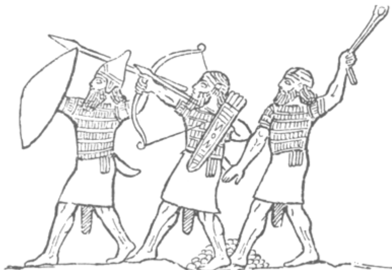
84. Asszír harcosok, középen egy íjász

Ikabod: Pinchász fia. A bibliai népetimológia 'oda van Izr. becsülete'-ként értelmezi a nevet, mert anyja akkor szülte, amikor hírére vette, hogy a → láda (Izr. dicsősége) elveszett: ellenség kezére került (1Sám 4,19–22). Minthogy a dicsőség héb. megfelelője nem használatos névelővel, Jahvéra (→ Isten dicsősége) is lehet gondolni. Ezért rendszerint 'becsület nélküli'-nek értelmezik.