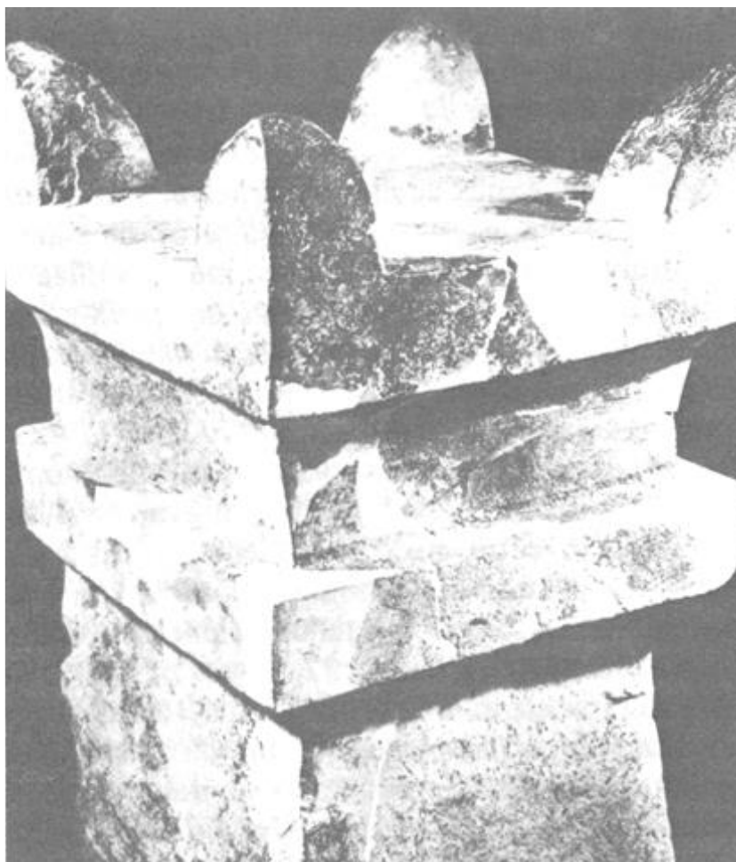
85. Illatáldozati oltár Megiddóból, sarkain szarvak